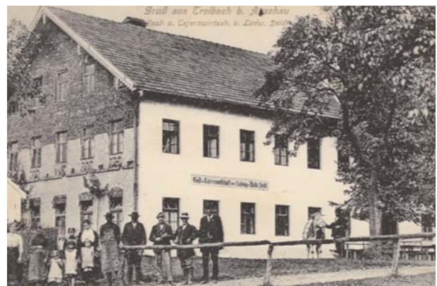
Gast- und Tafernwirtschaft in Troibach um 1920

Zusammenfassend, Troibach ist von der Ersterwähnung her, die zweitälteste Siedlung. Nur das Dorf Aschau wurde früher urkundlich erwähnt, nämlich 790 in der Notitia Arnonis. Als Siedlung dürfte Troibach schon viel früher als 924 bestanden haben, möglicherweise schon zur Römerzeit.