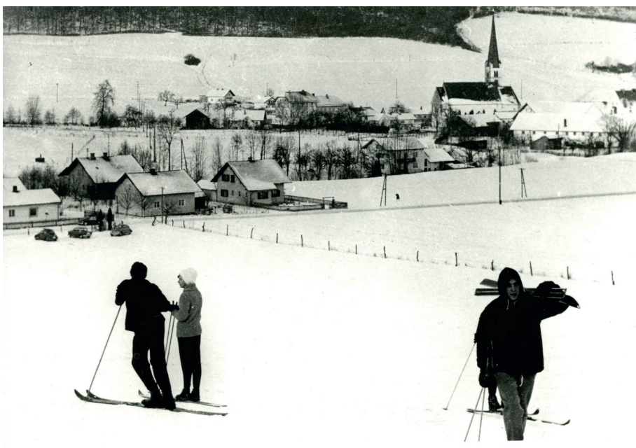
Wintersport auf Baimer Wiese Waldwinkler Str. 1960er Jahre