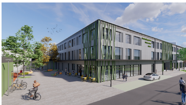
Sonderpädagogisches Förderzentrum Aschau: So wird der Neubau aussehen.

Landkreis Mühldorf a. Inn investiert 50 Millionen Euro in das neue Förderzentrum am Standort Aschau – Abbrucharbeiten am Campus Don Bosco haben bereits begonnen