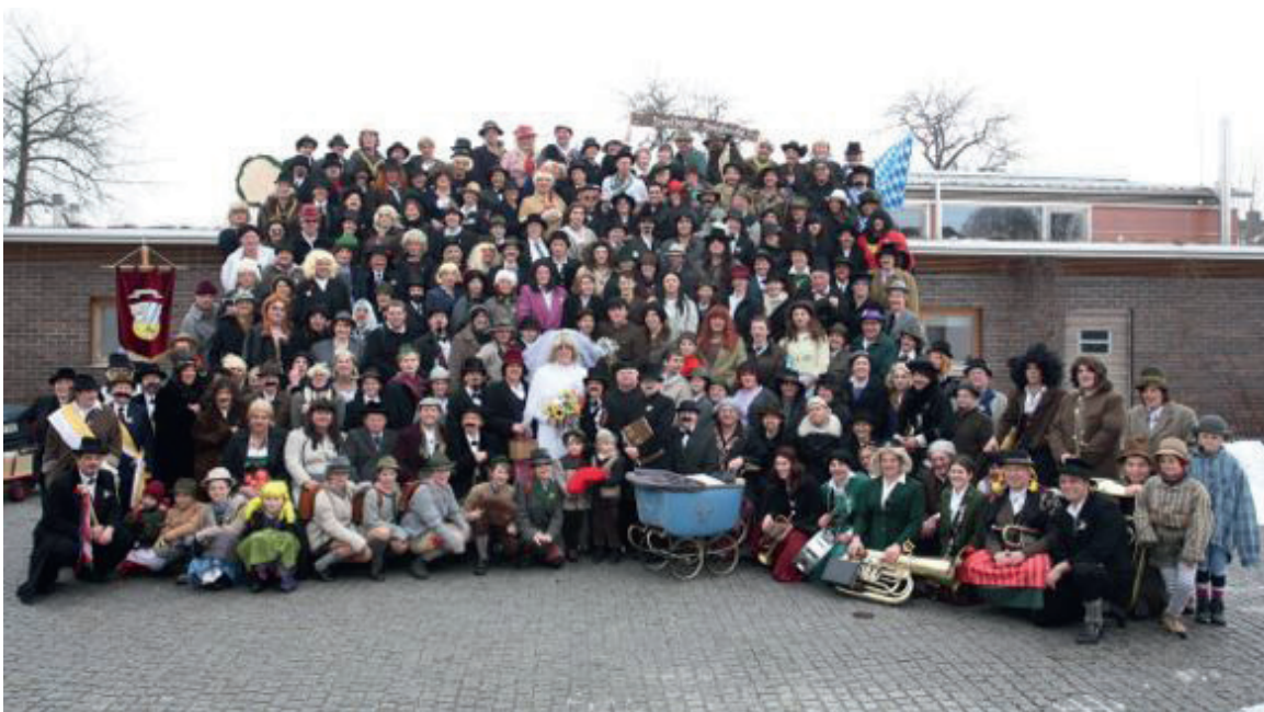
Faschingshochzeit 2015